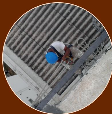
Treinamento de descida de cadeira suspensa NR 35