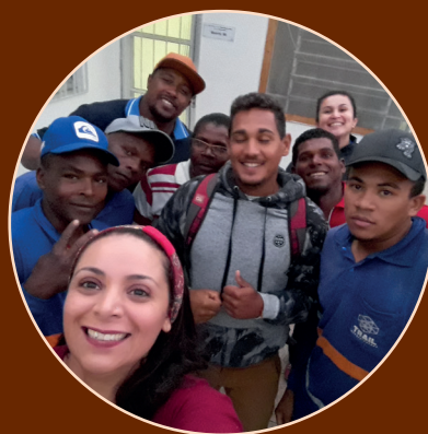
Treinamento de NR 35 e NR 18