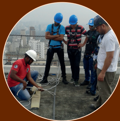
Treinamento NR 35 (ancoragem)