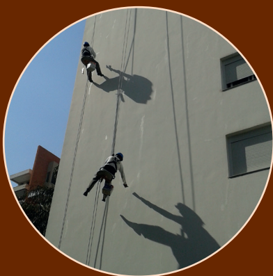
Trabalho em altura