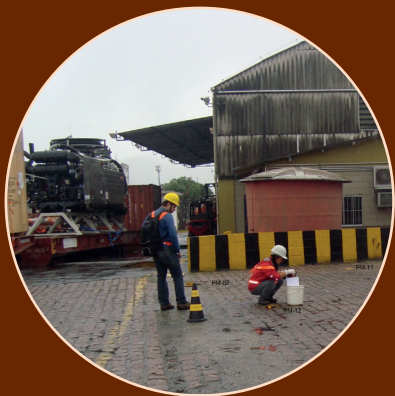
Inspeção de poços de monitoramento