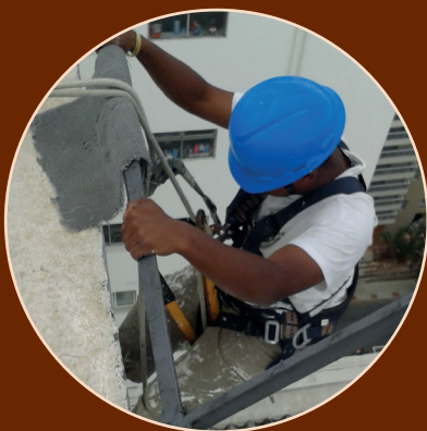
Treinamento de descida de cadeira suspensa NR 35