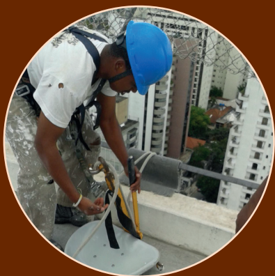
Treinamento de descida de cadeira suspensa NR 35