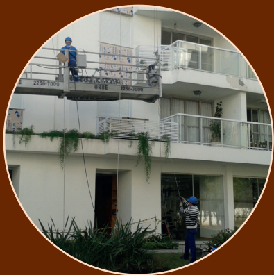
Fiscalização de EPIs; trabalho em altura