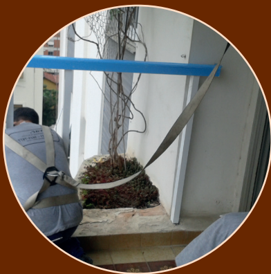
Ancoragem para troca de parapeito em sacada