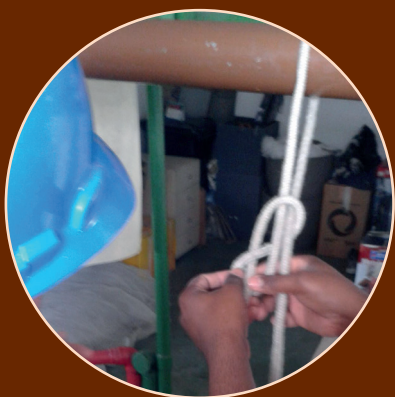
Treinamento NR 35; nós