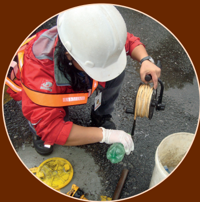
Medição de nível d'água subterrânea