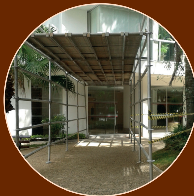
Túnel de passagem de pedestre na obra